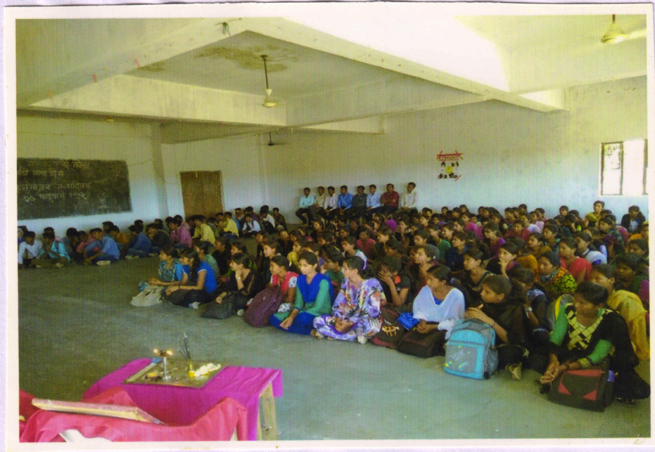
Students of college attending workshop