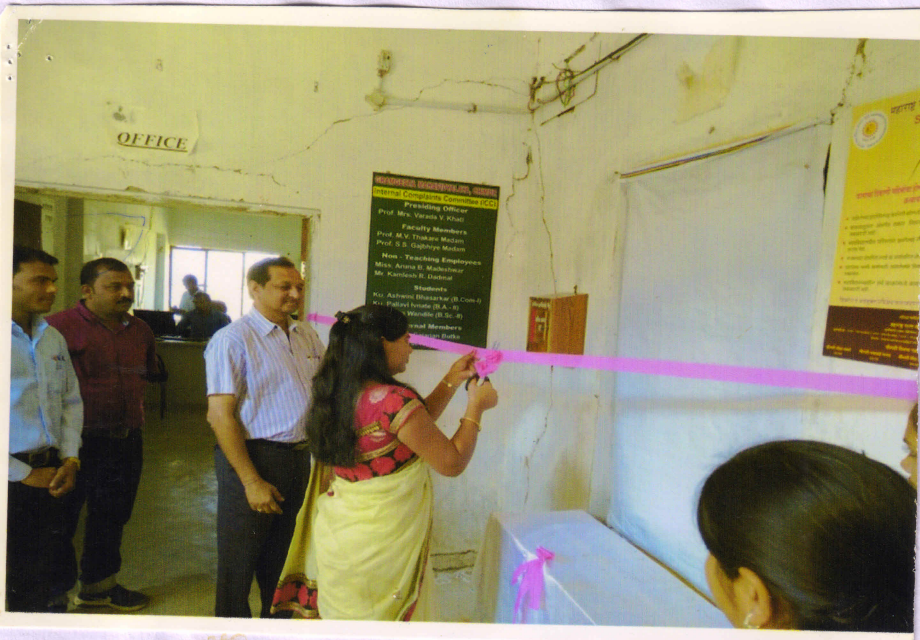
Inauguration of Women Complaint Box