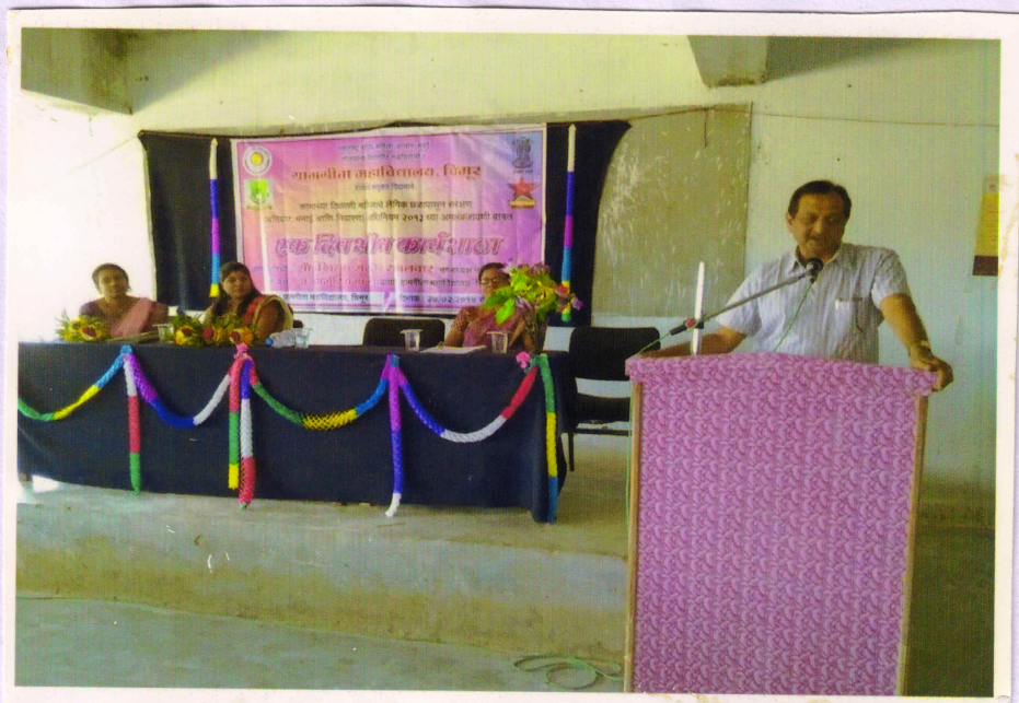
Chair person of programme and principal of the college addressing students.